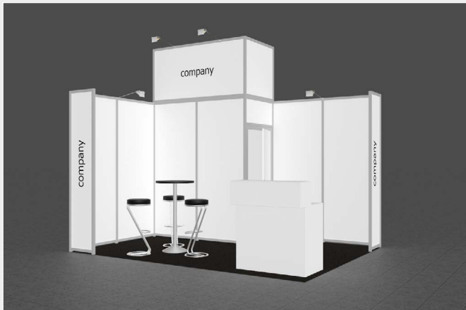
Musterskizze Komplettpaket · Example of complete package

buchbar ab 12 m 2 can be booked from 12 m 2