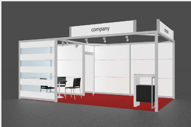
Musterskizze Komplettpaket · Example of complete package

buchbar ab 20 m 2 can be booked from 20 m 2