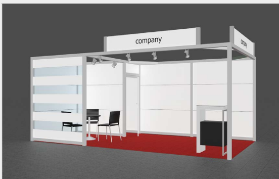
Musterskizze Komplettpaket · Example of complete package

buchbar ab 12 m 2 can be booked from 12 m 2