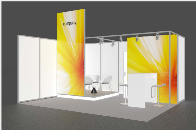
Musterskizze Komplettpaket · Example of complete package

buchbar ab 20 m 2 can be booked from 20 m 2