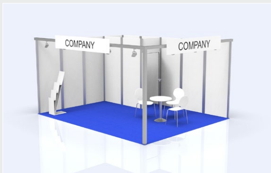
Musterskizze Komplettpaket · Example of complete package