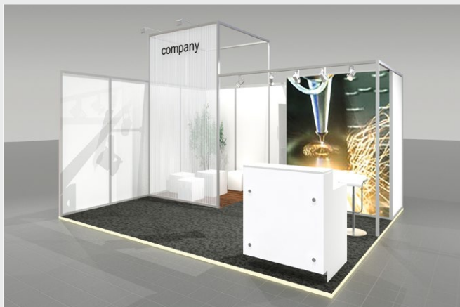
Musterskizze Komplettpaket · Example of complete package

buchbar ab 20 m 2 can be booked from 20 m 2