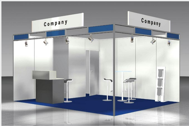
Musterskizze Komplettpaket · Example of complete package