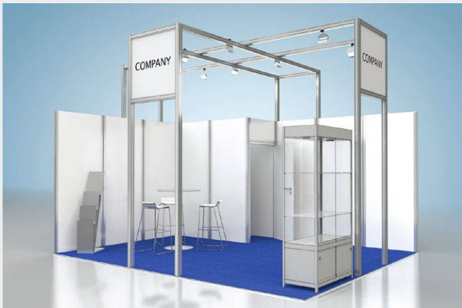
Musterskizze Komplettpaket · Example of complete package

buchbar ab 16 m 2 can be booked from 16 m 2