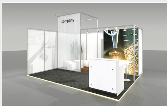
Musterskizze Komplettpaket · Example of complete package