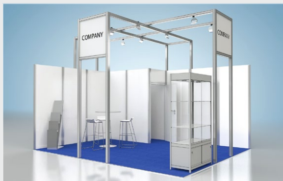
Musterskizze Komplettpaket · Example of complete package