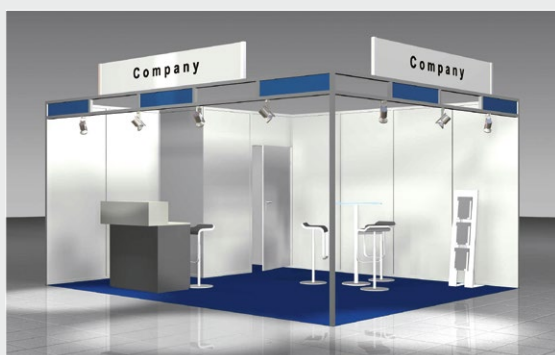
Musterskizze Komplettpaket · Example of complete package