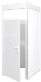
Réserve fermant à clé