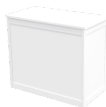
Theke ohne Aufsatz