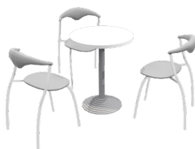
Sitzgruppe (3 Stühle inkl. Tisch)