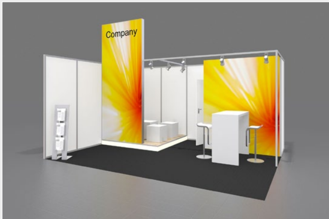
Musterskizze Komplettpaket · Example of complete package

buchbar ab 20 m 2 can be booked from 20 m 2