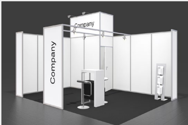
Musterskizze Komplettpaket · Example of complete package

buchbar ab 12 m 2 can be booked from 12 m 2