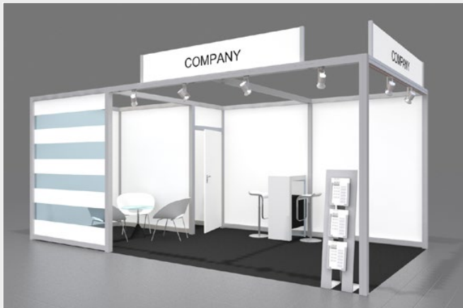
Musterskizze Komplettpaket · Example of complete package

buchbar ab 20 m 2 can be booked from 20 m 2