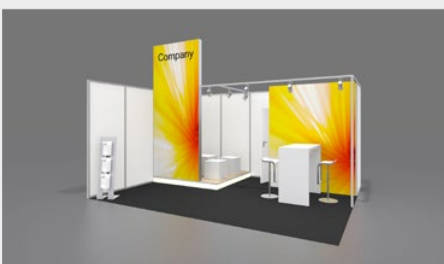
Musterskizze Komplettpaket · Example of complete package