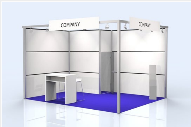
Musterskizze Komplettpaket · Example of complete package