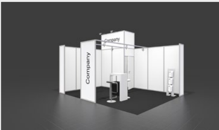
Musterskizze Komplettpaket · Example of complete package