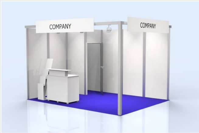
Musterskizze Komplettpaket · Example of complete package