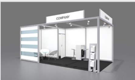
Musterskizze Komplettpaket · Example of complete package