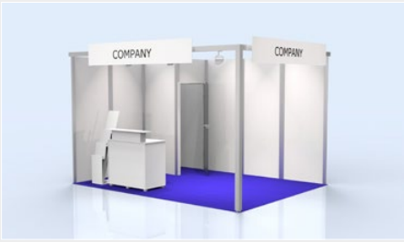
Musterskizze Komplettpaket · Example of complete package