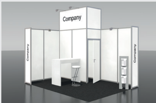
Musterskizze Konzeptpaket · Example of complete package

buchbar ab 12 m 2 can be booked from 12 m 2