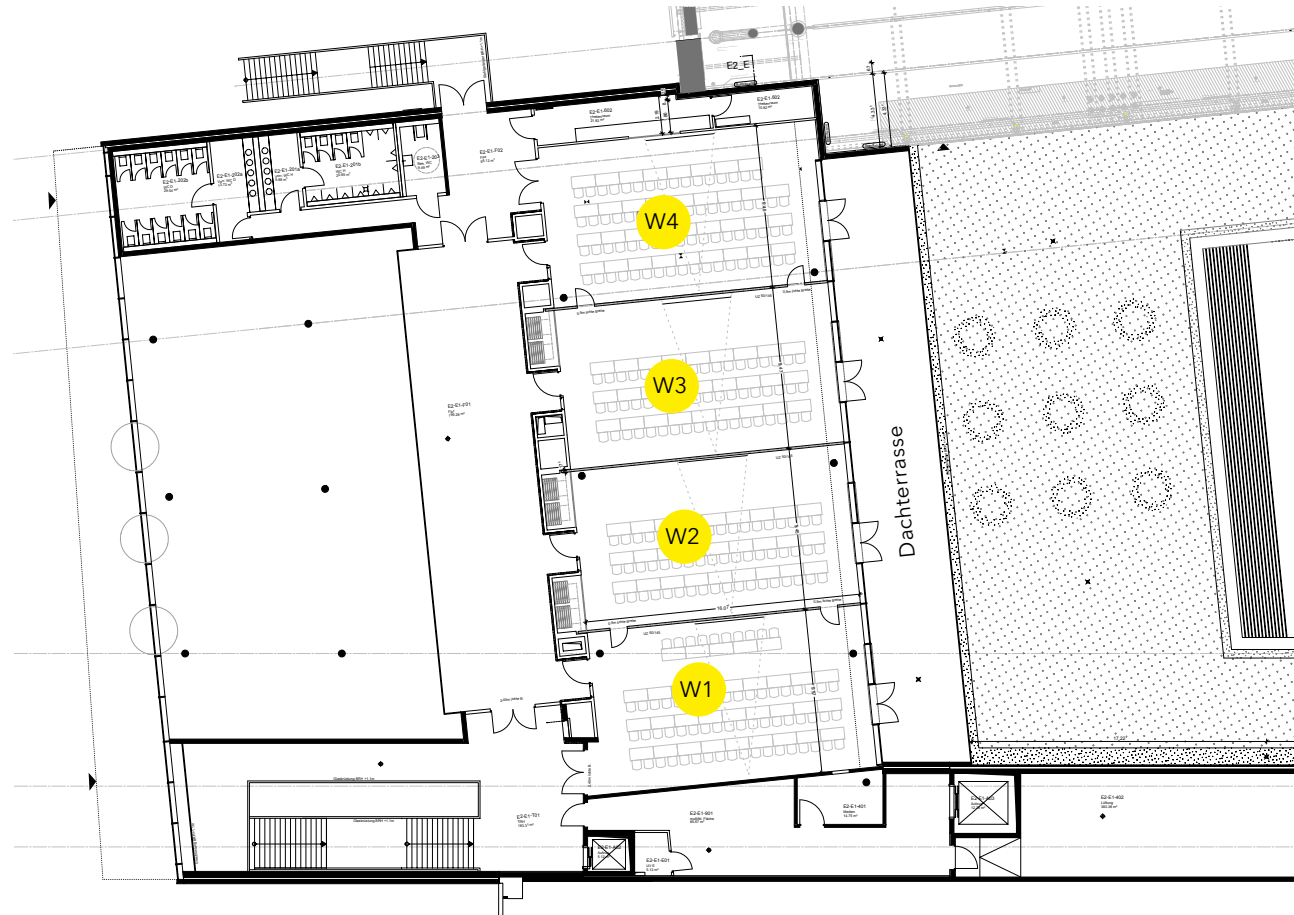
Paul Horn Halle (Halle 10)