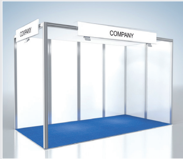
Musterskizze Basispaket Example of basic basic package