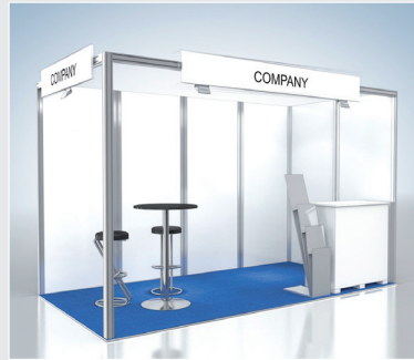
Musterskizze Komplettpaket Example of complete package