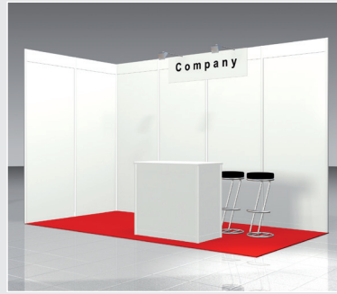
Musterskizze Komplettpaket Example of complete package